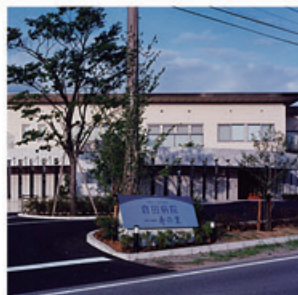
倉田病院 (管理病棟増築・改修・解体)