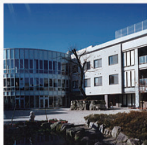
滋賀里病院 (病棟増築・病棟解体・改修・解体)