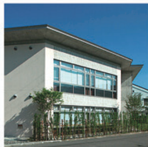
寿の里 (増床増築・改修)