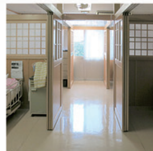
真寿園 (プライバシー保護・浴室棟増築・既存浴室改修)

「介護・医療施設」では、建物の経年変化により改修などの必要がでてきます。利用者のニーズも変わり、介護・医療機器も多様化しています。皆様の施設では修繕・改修・改築の中期・長期の計画をお持ちでしょうか。